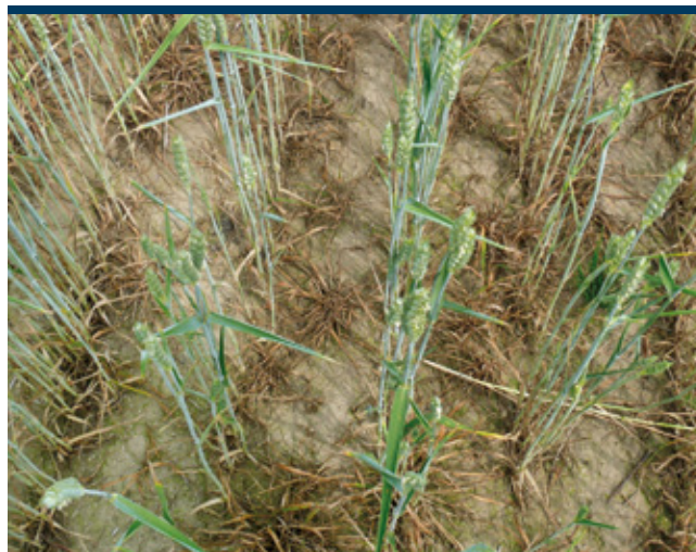
Axial One nagy széltippán elleni hatása Vas megye, Rum, 2011.