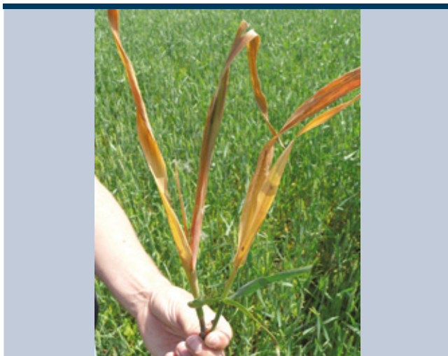
Axial One vadzab elleni hatása Békés megye, Gyula, 2011.