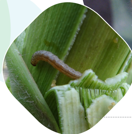
Kukoricamoly lárvája kukorica szárán