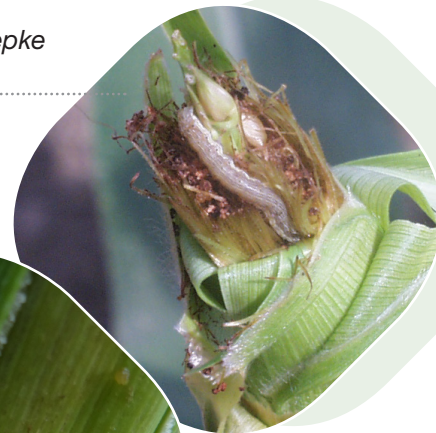
Gyapottok bagolylepke kártétele kukoricán

A Voliam kukoricabogár imágók ellen nem határos, erős kukoricabogár imágó jelenlét esetén egészítsük ki Karate Zeon rovarölőszerral vagy használjuk a gyári kombinációt, az Ampligo-t. A készítményhez nedvesítő szer hozzáadása javasolható (pl. Fix-Pro vagy Eucarol Plus).